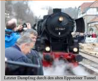
Letzter Dampfzug durch den alten Eppsteiner Tunnel