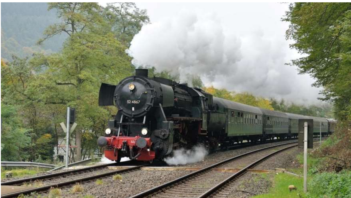
Auf der Hinfahrt bei Friedrichslegen

Für alle, die dabei waren, war als ein grandioser Saisonabschluss 2015, die Fahrt mit unserem Sonderzug „RHEINPFIL“ am 18. Oktober nach Koblenz mit Dampf und nach Lokwechsel weiter mit E 40 nach Cochem an der Mosel. Und auch das Wetter spielte mit, wie nachfolgende Fotostrecke eindrucksvoll belegt.