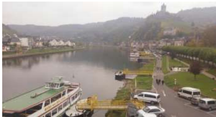
Cochem an der Mosel mit Reichsburg

Für alle, die dabei waren, war als ein grandioser Saisonabschluss 2015, die Fahrt mit unserem Sonderzug „RHEINPFIL“ am 18. Oktober nach Koblenz mit Dampf und nach Lokwechsel weiter mit E 40 nach Cochem an der Mosel. Und auch das Wetter spielte mit, wie nachfolgende Fotostrecke eindrucksvoll belegt.