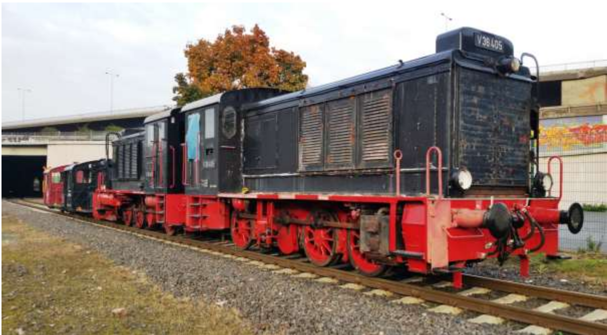
Vorbereitung der Überführungsfahrt am 23.10.2015 nach Wiesbaden Ost Gbf