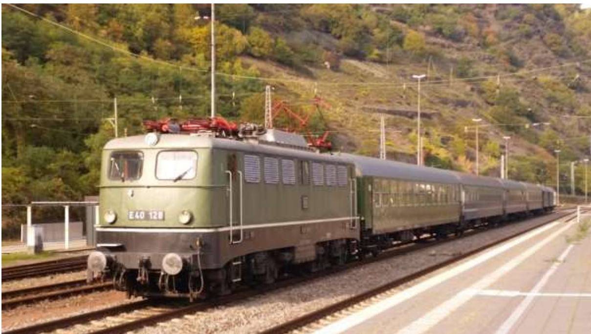
Mit E 40 128 bei Sonnenschein unterwegs nach Cochem