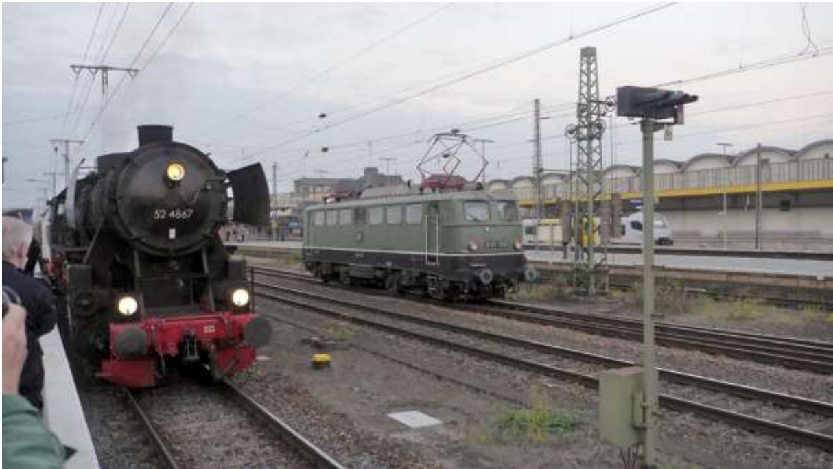
Auf Hin- und Rückfahrt Lokwechsel in Koblenz Hbf