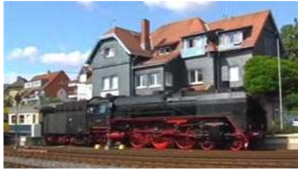
youtube-Video von den Fahrten der Dampfzüge auf der K-Bahn in früheren Jahren

Den Fahrplan der Sonderzüge finden Sie hier