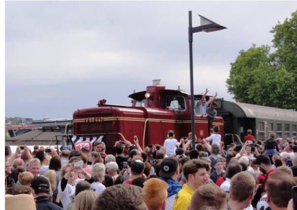
Auch die Eintracht Fahne an der Lok konnte nicht verhindern, dass die so genannten Fans den Leerzug stürmten

Nicht ganz so reibungslos gestaltete sich die Rückfahrt des Diesel-Zuges am Pfingstsonntag vom Eisernen Steg ins Depot. Die Fans des Pokalsiegers Eintracht Frankfurt feierten ihren Triumph nicht nur auf dem Römerberg, sondern auch in den Parkanlagen am Main und auf den Gleisen der Hafensbahn. Als unser Zug gegen 18:00 Uhr dort eintraf, wurde er von wenigen randalierenden Fans quasi gestürmt, sie trommelten mit Fäusten und Füßen gegen die Wagen und Fenster und warfen mit einer Bierflasche eine Scheibe ein. Diese wurde noch in der Nacht von drei Mann repariert. Dass die Weiterfahrt dennoch ohne Personenschaden abging, grenzt - auch der Umsichtigkeit unseres Personals und des Lokführers geschuldet - fast an ein Wunder. Doch lassen wir die Taunus Zeitung und die Fotos „unserer“ Fotografen über den Ablauf des Festes sprechen.