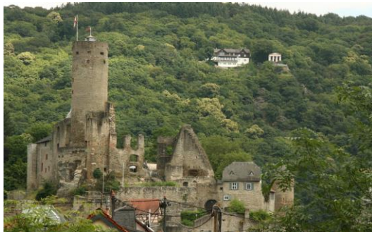
Burg und Ritter Eppo (s. letzte Seite) rufen auch 2018

„verkaufen“ können. Als eine Art Anerkennung für das von der Stadt an den Tag gelegte Engagement zur Sanierung des historischen Empfangsgebäudes in Verbindung, mit dem Bau einer