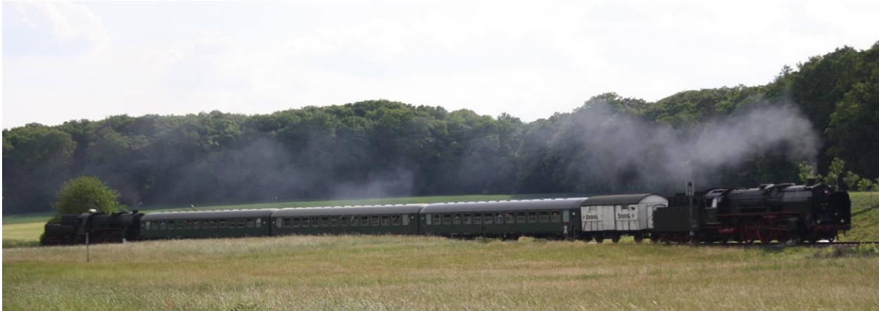
Dampf oder Diesel, beide haben ihren Reiz und beide Züge Ihre Fans

ich hier auf der Lok bin, habe ich alles – Fitnessstudio und Sauna“, sagt sie und spielt damit auf die Hitze und die schweißtreibende Arbeit im Führerstand an. Denn der Kessel muss permanent befeuert werden, damit er seine Arbeit leistet. „Aber“, so Zscherneck, „hier ist alles robust. Hier geht nix kaputt“. Das sei in den modernen digitalen Nachfolgern nicht immer so.