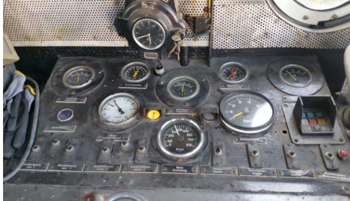
65 Jahre liegen dazwischen, der Berichterstatte mit 13 und 78 Jahren