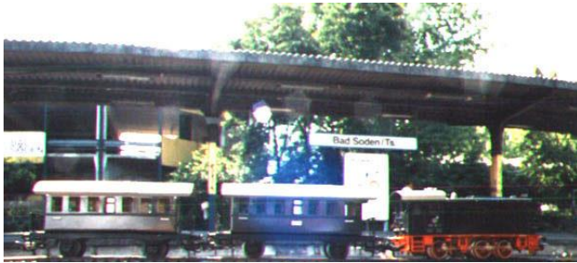
„Spasbild“: V 36 mit Plattformwagen in Bad Soden

Vorstehendes zur Einordnung und Einsortierung meiner weiteren Ausführungen. Doch jetzt endlich zum Anlass meines Berichtes. Mit der Baureihe V 36 verbinden mich unvergessliche Erinnerungen. Ich besuchte, das sind inzwischen unvorstellbare 65 Jahre her, das Leibniz-Realgymnasium in F-Höchst; die „Volksschule“ und die Unterstufe bis zur Trennung unserer Wege übrigens gemeinsam mit dem Endredakteur des Newsletters. Zur Schule nach Höchst ging es natürlich mit der Bahn. Bis etwa 1948 verkehrten dreifach gekuppelte Dampfloks, danach eine Zeitlang die BR V36.