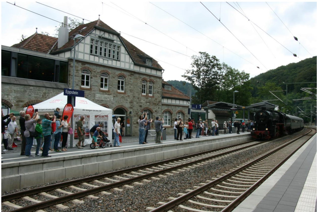
Mit Spannung erwartet: Ankunft des Ersten Zuges am 09. Juli 2016 in Eppstein

Den genauen Ablauf der Aktivitäten und Attraktivität der am Stadtbahnhof entnehmen Sie bitte der Homepage der Stadt Eppstein. Den Fahrplan unseres Zuges und die Fahrpreise finden Sie wie üblich auf der Homepage der HEF. Der Fahrkartenvorverkauf ist bereits eröffnet.