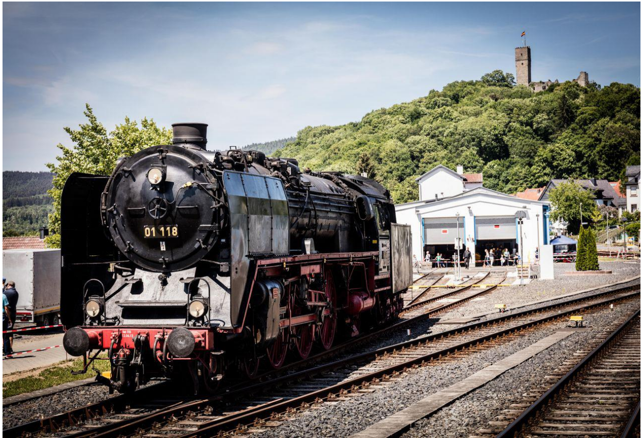
Führerstandsmitfahrten auf der 01 im Bahnhof Königstein, ein unvergessliches Erlebnis für Groß und Klein