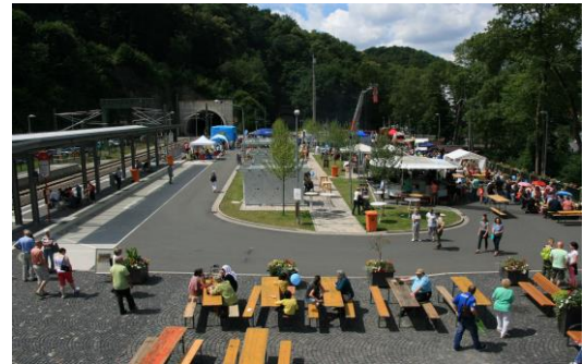
Auch 2018: Großes Festgelände am Stadtbahnhof