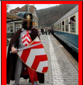
Bild rechts: Ritter Eppo erwartet die kleinen und großen Festgäste am Stadtbahnhof Eppstein