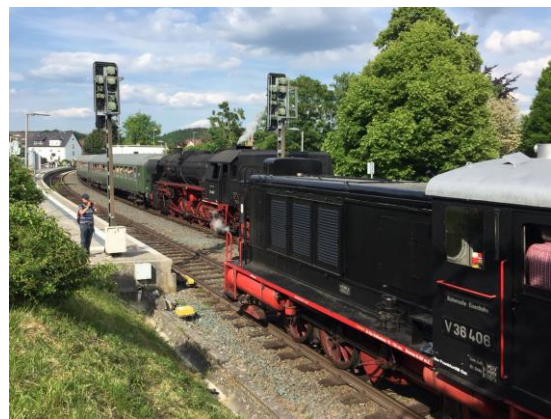
Erstmals in der 38 jährigen Geschichte der Veranstaltung Kreuzung in Hornau, bedingt durch die Verlagerung der Kreuzung der RB 12 nach Höchst