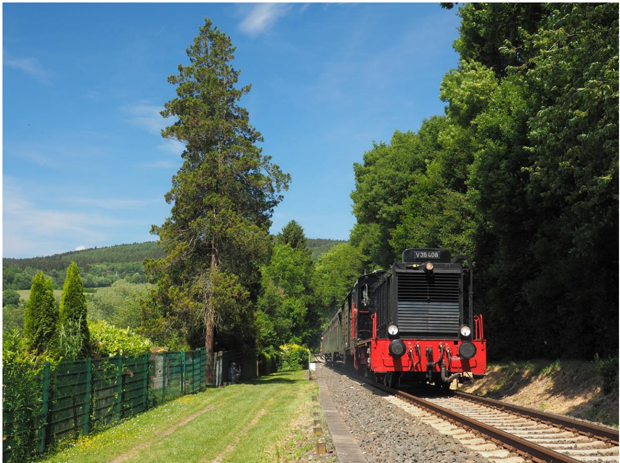
V 36 mit letzter Kraft kurz vor dem Einfahrtsignal Königstein

Bereits zum 38. Mal stand das Bahnhofsfest in Königstein unter dem Motto MIT VOLLDAMPF IN DEN TAUNUS . Ein Besucher bemerkte, dass es für ihn immer wieder von neuem erstaunlich ist, was so ein kleiner Verein in der Lage ist, so reibungslos und pannenfrei auf die Beine zu stellen. Wenn man sich die Videofilme auf YouTube („Mit Volldampf in den Taunus 2018“ und ganz besonders „Führerstandsmitfahrt auf 52 4867 ...“ von Daniel Schneider) ganz wertneutral anschaut, dann dürfte das alle Beteiligten mit ganz besonderem Stolz erfüllen. Für eine solch tolle Werbung für die Arbeit und die Fähigkeit der Mitglieder des Vereins dürfte sich so manch anderer Eisenbahnclub die Finger lecken. Dank an dieser Stelle auch einmal an die Videofilmer und ganz besonders an die Fotografen, die den Berichtersteller jeweils mit so tollen Aufnahmen versorgen- Kompliment.