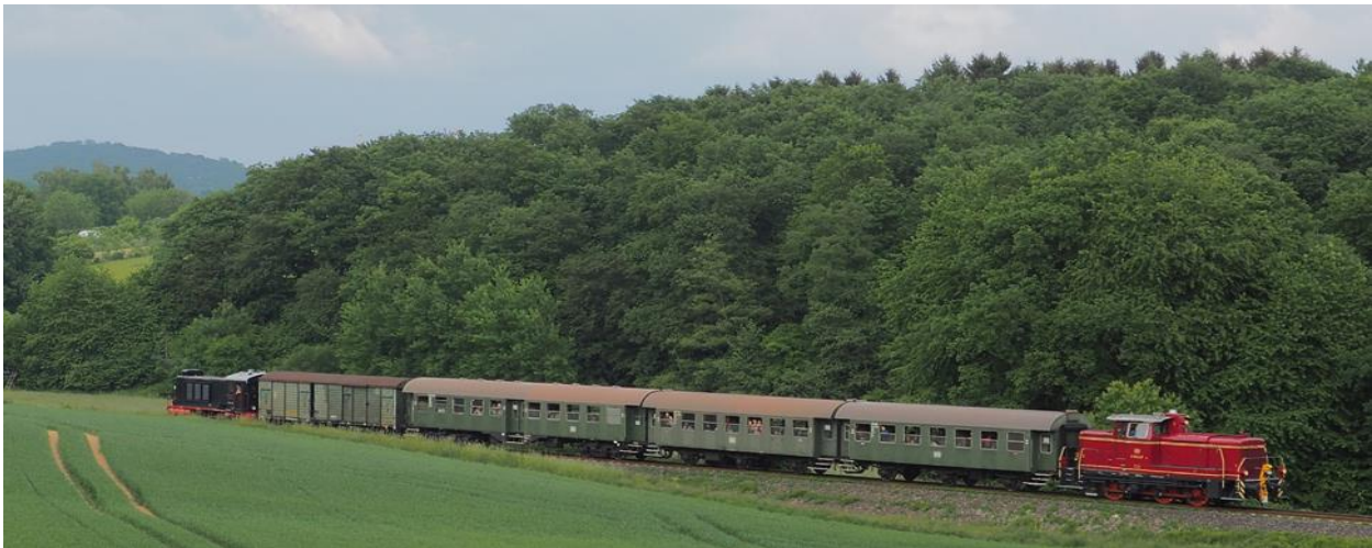
Beliebter Fotopunkt: Die Schneidhainer Wiesen am Sportplatz