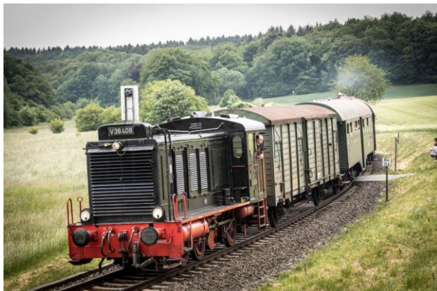
Der Diesenzug komplettierte den Stundentag