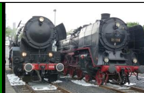
Mit 2 Dampfloks nach Meiningen!