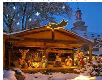
Krippe auf dem Marktplatz

Der besinnliche Markt beherbergt das größte deutsche Krippengelände. Über 100 festlich geschmückte Markthäuschen bieten weihnachtliche Waren aus aller Welt. Kerzenzieher, Holzschnitzer, Glas- und Brandmaler sowie Zinngießer fertigen Geschenke und Kunsthandwerk nach Ihren Wünschen. Spezialitäten aus aller Welt, Rheingauer Festgerichte und Glühwein, sorgen für das leibliche Wohl.