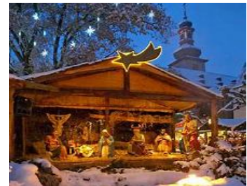
Krippe auf dem Marktplatz

Der besinnliche Markt beherbergt das größte deutsche Krippengelände. Über 100 festlich geschmückte Markthäuschen bieten weihnachtliche Waren aus aller Welt. Kerzenzieher, Holzschnitzer, Glas- und Brandmaler sowie Zinngießer fertigen Geschenke und Kunsthandwerk nach Ihren Wünschen. Spezialitäten aus aller Welt, Rheingauer Festgerichte und Glühwein, sorgen für das leibliche Wohl.