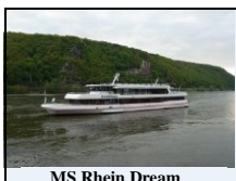
MS Rhein Dream

a) 2 Erwachsene und 2 Kinder. Kinder von 4 bis 14 Jahre erhalten ca. 50 % Ermäßigung. Kinder unter 4 Jahren fahren ohne Anspruch auf einen Sitzplatz frei. Bei Beanspruchung eines Sitzplatzes ist ein Kinderfahrausweis erforderlich.