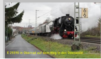
E 25590 in Oberrod auf dem Weg in den Odenwald