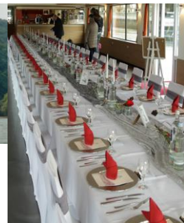
Tafel bei festlichen Anlässen

„MS RheinStar“ (hier vor der Burg Rheinstein) mit 3 Decks und Platz für bis zu 600 Personen. Bordküche; behindertenfreundliche Ausführung. Weihnachtliche Musikuntermalung, Erklärungen der Sehenswürdigkeiten.