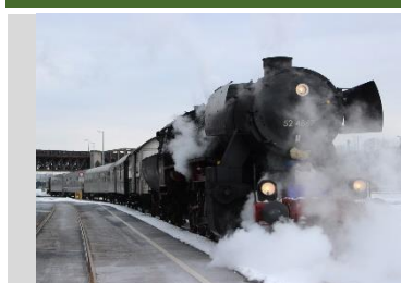
Stand: 05.11.2021