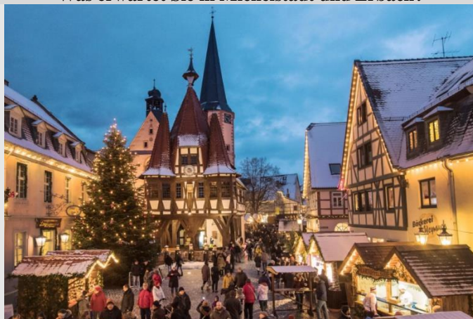
Der Weihnachtsmarkt rund um das weltberühmte Rathaus Michelstadt