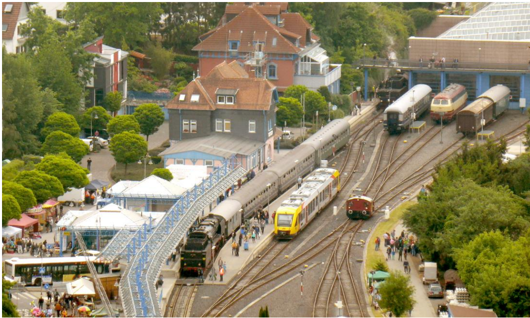
Bahnhofsfest Königstein im Taunus, Pfingsten 2015