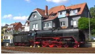
YouTube-Video von den Fahrten der Dampfzüge auf der K-Bahn in früheren Jahren

Den Fahrplan der Sonderzüge finden Sie hier